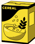
Cereal para bebé- 16 onzas