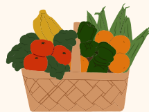
Beneficios de valor en efectivo (CVB)- $22.00