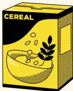
Cereal para bebé- 16 onzas